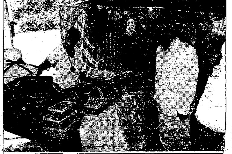
● من للعرض